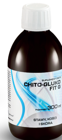
CHITO-GLUKO FIT G