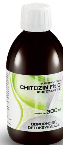
CHITOZIN FIT C